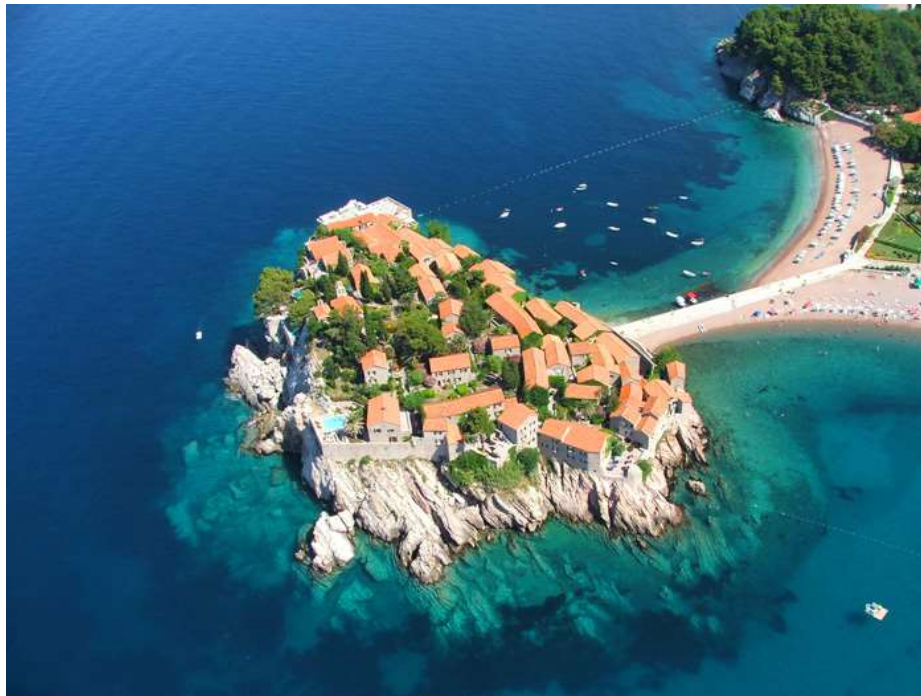
En la foto aérea, Isla Sveti Stefan.

Desayuno. Salida hacia Budva. El pasado lejano se remonta al siglo V a.C. Según los numerosos Leyendas Budva fue en primer lugar la ciudad de Iliria. Sus primeros habitantes fueron el rey de la históricamente conocida Tebe - Kadmo y la Reina Harmonia. Parada fotográfica de la isla Sveti Stefan .