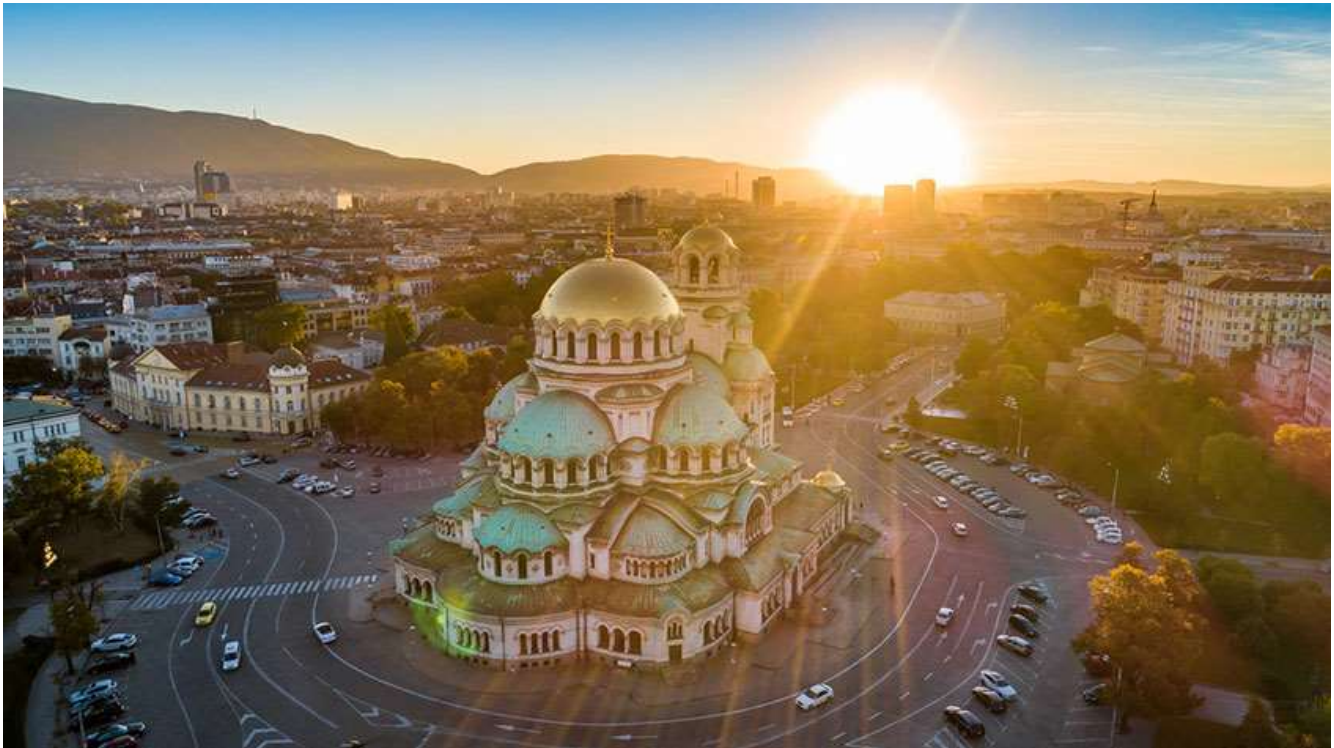
Catedral de San Alejandro Nevski en Sofía - Bulgaria