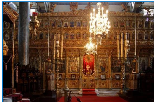
Catedral de San Jorge