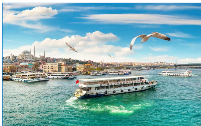
Paseo en barco por el Bósforo.