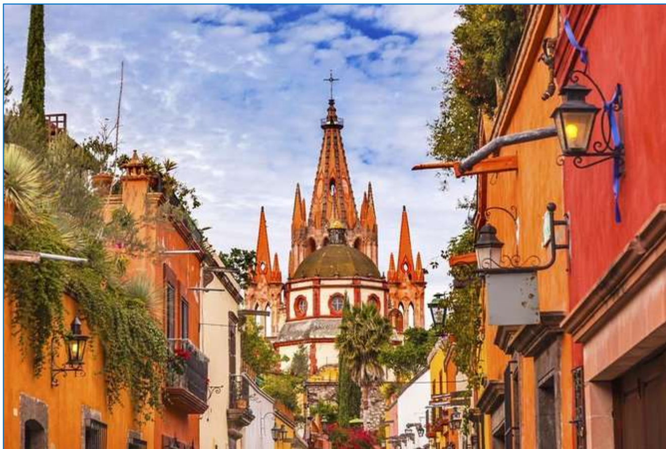
Foto: San Miguel de Allende.

Desayuno americano en el hotel. A las 08:00 horas, salida por carretera hacia Querétaro, bella ciudad virreinal. Visita panorámica de la ciudad: Acueducto, Mirador, Plaza de la Independencia (Palacio de Gobierno y Casa López de Ecala), Casa y Plaza de la Corregidora, Teatro de la República, Casa de la Marquesa, Templos de Santa Clara y San Agustín, Casa de los Perros. Tiempo libre. Almuerzo de bienvenida. (sin bebidas). Continuación al pueblo-museo de San Miguel de Allende. Visita panorámica de su armonioso centro histórico. Tiempo libre para deambular por sus calles, plazuelas, tiendas. Alojamiento en el hotel.