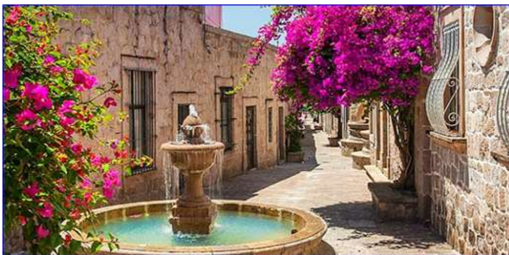
Foto: Acueducto en Morelia.